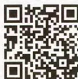
Video plongée à Socorro

L'île Socorro est une île volcanique mexicaine des Îles Revillagigedo dans l'océan Pacifique à environ 600 kilomètres des côtes mexicaines. On atteint ce spot en croisière au départ de Cabo San Lucas.