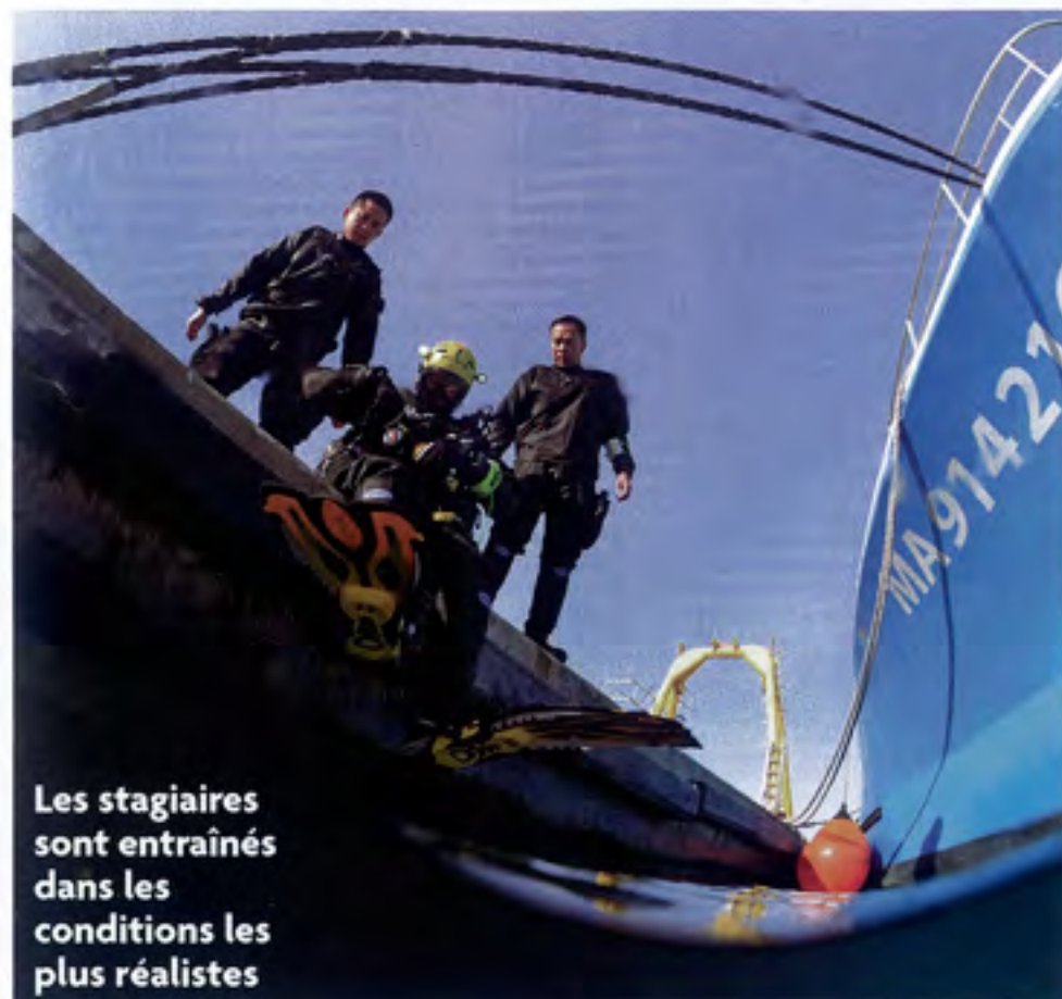
Les stagiaires sont entraînés dans les conditions les plus réalistes