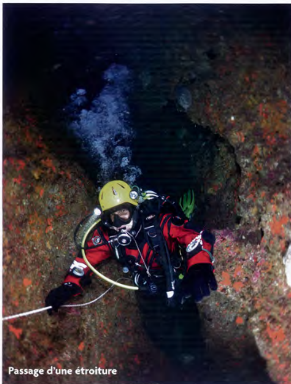
Passage d'une étroiture