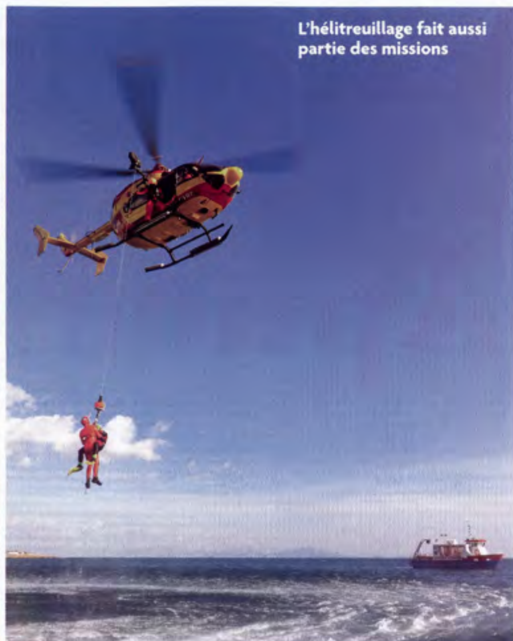
L'hélicoptère fait aussi partie des missions