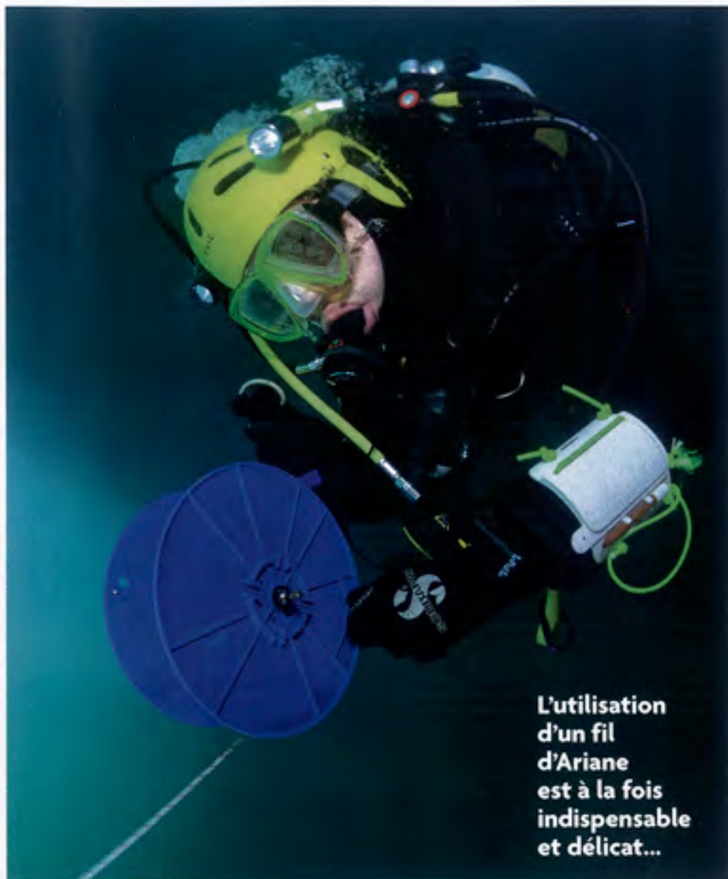
L'utilisation d'un fil d'Ariane est à la fois indispensable et délicat...